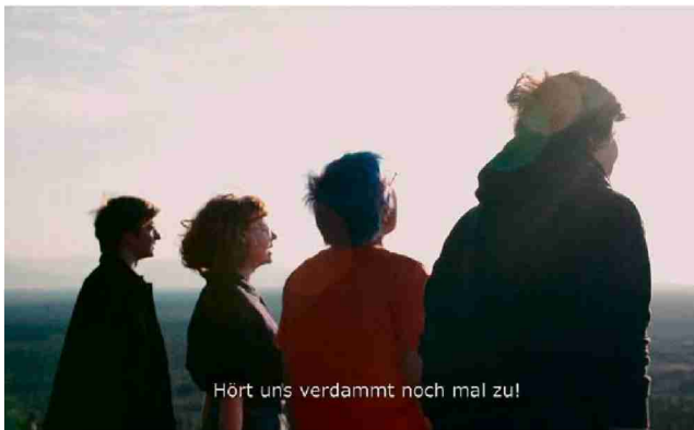
Viel Film aus der Alten Fabrik: Die Kuratoren stellen verschiedene Videos zusammen, die in der Online-Ausstellung zuhause angeschaut werden können.